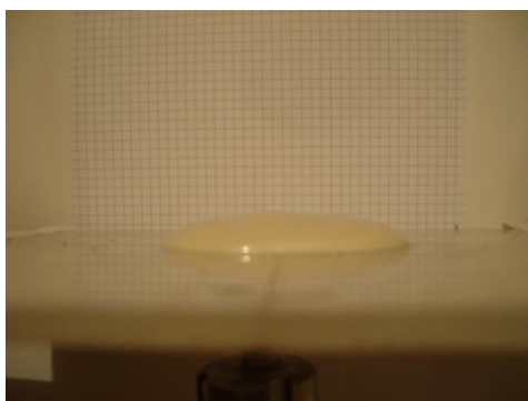
Рис. 4. Размерная сетка для измерений скорости растекания теста

Для исследования растекания навески теста было выбрано пшеничное теста изготовленное по такой же рецептуре что при исследовании реологических зависимостей.