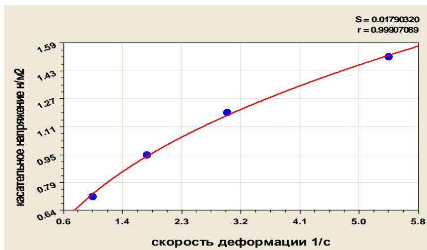
Рис. 2. Примерная реометрическая кривая

В качестве цели дальнейших исследований нами был поставлен выбор метода исследования скорости растекания теста, позволяющий определить ее значения для использования в численном анализе полученных модельных представлений о процессе заполнения формы.