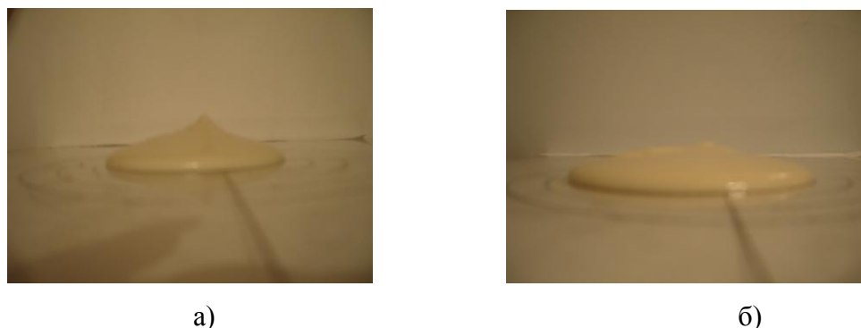
Рис. 5. Навеска теста в различные моменты времени:

Используя модель дозатора, пшеничное тесто наливали на пластину с расположенной перпендикулярно ей размерной сеткой. Путем скоростной съемки процесса растекания навески теста по пластине с периодом времени 0,50 с был получен ряд цифровых фотоизображений.