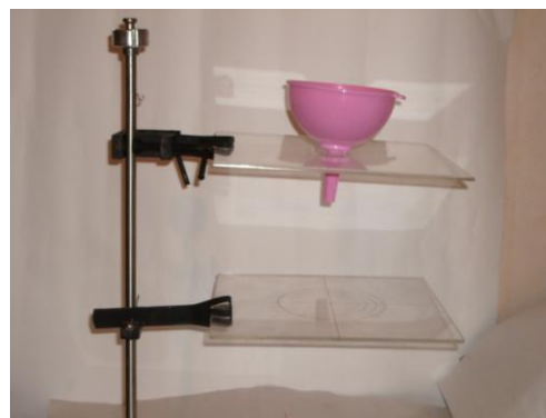
Рис. 3. Модель дозатора

Для исследования растекания навески теста было выбрано пшеничное теста изготовленное по такой же рецептуре что при исследовании реологических зависимостей.