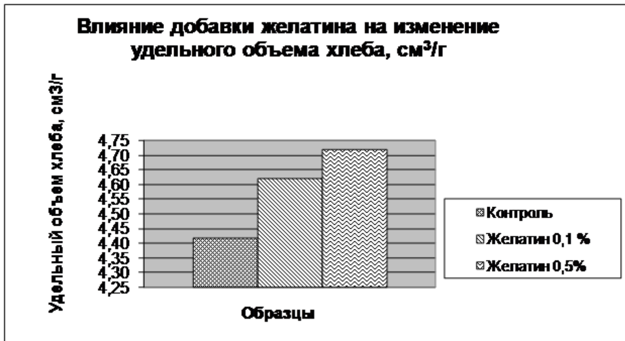
Рис. 1. Изменение удельного объема пшеничного хлеба при внесении 0,1 и 0,5% желатина

Изменение удельного объема хлеба при добавлении желатина приведено на рис.1.